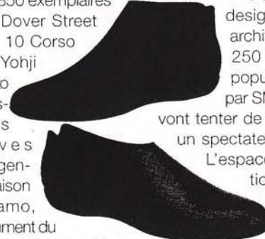
Chaussures Yohji Yamamoto.

détourné avec maîtrise la féminité de la marque. A nos pieds, cet hiver, parmi les huit modèles annoncés, les bottines plates ultra-pures à l'unique couture à l'arrière qui ne font qu'un avec le pied. Palette : noir, rouge, beige, rose, marine, brun.