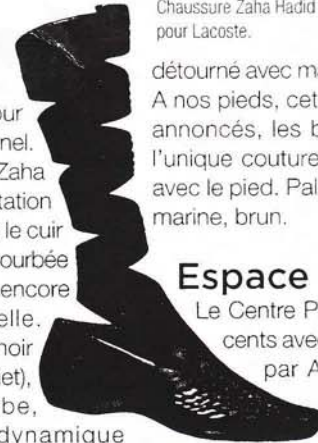
Chaussure Zaha Hadid pour Lacoste.

Deux collaborations fusionnent pour le meilleur du design et du fonctionnel. S'attaquant à la marque Lacoste, Zaha Hadid a travaillé sur une réinterprétation digitale du logo mythique, reliefant le cuir au niveau de l'orteil et sur la partie courbée de la chaussure, motif qui court encore sur le caoutchouc de la semelle. Les deux modèles, masculin (en noir et marine) et féminin (en noir et violet), s'enroulent autour de la jambe, comme une enveloppe à la dynamique fluide. Une édition limitée de 850 exemplaires à découvrir chez Colette, Dover Street Market, 10 Corso Como. Yohji Yamamoto s'est inspiré des archives de la légendaire maison Ferragamo, et notamment du modèle emblématique Vara. "Les chaussures sont l'accessoire le plus difficile à dessiner. Il est impossible de tricher", commente le créateur qui a exploité un savoir-faire d'exception et