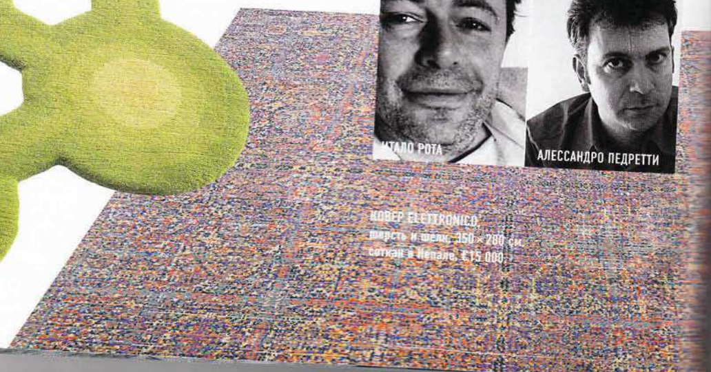
КОВЕР ELECTRONICO , шерсть и шелк, 350 × 280 см, соткан в Непале, €15 000.