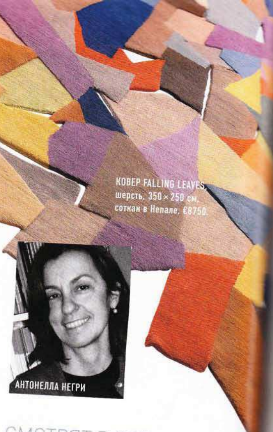
КОВЕР FALLING LEAVES , шерсть, 350 × 250 см, соткан в Непале, €8750.